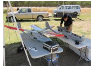
Aviones no tripulados para medición de necesidades hídricas.

Conectar o crear una cuenta de usuario para comentar.